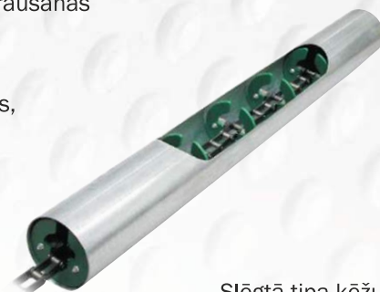
SlĒgtā tipa kĒžu transportiera sĪstĒma ir izstrādāta, tā lai saglabātu graudu kvalitāti

SlĒgtā tipa kĒdes transportiera sĪstĒmu var uzstādĪt netika jaunus projektos, bet gan jau esošos uzglabāšanas bunkuros. SĪstĒma var tikt novietota arī slĪpumā, ja tas ir nepieciešams, piemĒram, pie bunkuru izkraušanas.